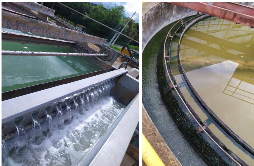
Estação de tratamento de efluentes

Tão importante quanto manter a qualidade que entra é a que devolvemos para Meio Ambiente. Pensando nisso, grandes investimentos foram e estão sendo feitos nas estações de tratamento de efluentes das unidades da Itambé para aperfeiçoamento das instalações e aumento da performance de tratamento a níveis muito superiores aos solicitados pela legislação ambiental.