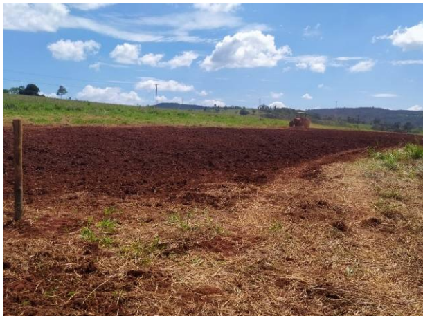
Aplicação de lodo no solo como biofertilizante para plantação de capim

A destinação dos resíduos é feita buscando sempre a preservação do Meio Ambiente e a valorização dos resíduos. Assim muitos resíduos são utilizados como matéria-prima na cadeia produtiva de outras indústrias.