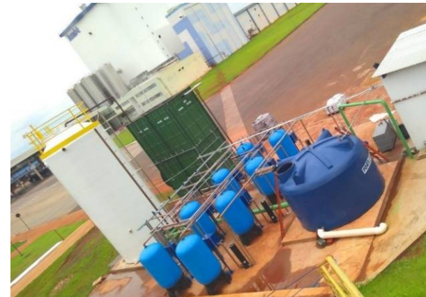
Estação de tratamento de água para reuso

Através de sistemas de tratamento para reutilização das águas geradas no processo de fabricação do leite em pó, “água de vaca”, a Itambé reduziu mais de 30% da exploração de poços artesianos nas unidades de Sete Lagoas, Uberlândia e Goiânia.